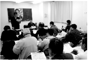
国会報告会(12/18北浦和西口)