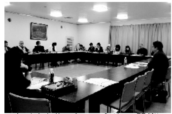
たけまさ公一と語る会(毎月開催)