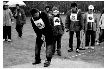
3/24 ゲートボール大会